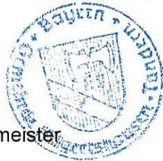
..... Dr. Markus Hertlein, 1. Bürgermeister

Die Verarbeitung personenbezogener Daten erfolgt auf der Grundlage der Art. 6 Abs. 1 Buchst. e (DSGVO) i. V. mit § 3 BauGB und dem BayDSG. Sofern Sie Ihre Stellungnahme ohne Absenderangaben abgeben, erhalten Sie keine Mitteilung über das Ergebnis der Prüfung. Weitere Informationen entnehmen Sie bitte dem Formblatt „Datenschutzrechtliche Informationspflichten im Bauleitplanverfahren“ das ebenfalls öffentlich ausliegt.